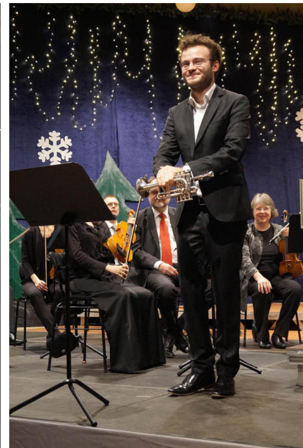
Silvesterkonzert „Perlen des Barock“ mit Simon Höfele und der Neuen Philharmonie Westfalen