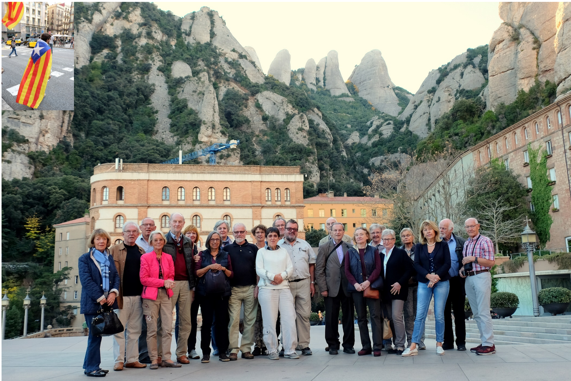
Studienreise nach Barcelona, 26-29. Okt.